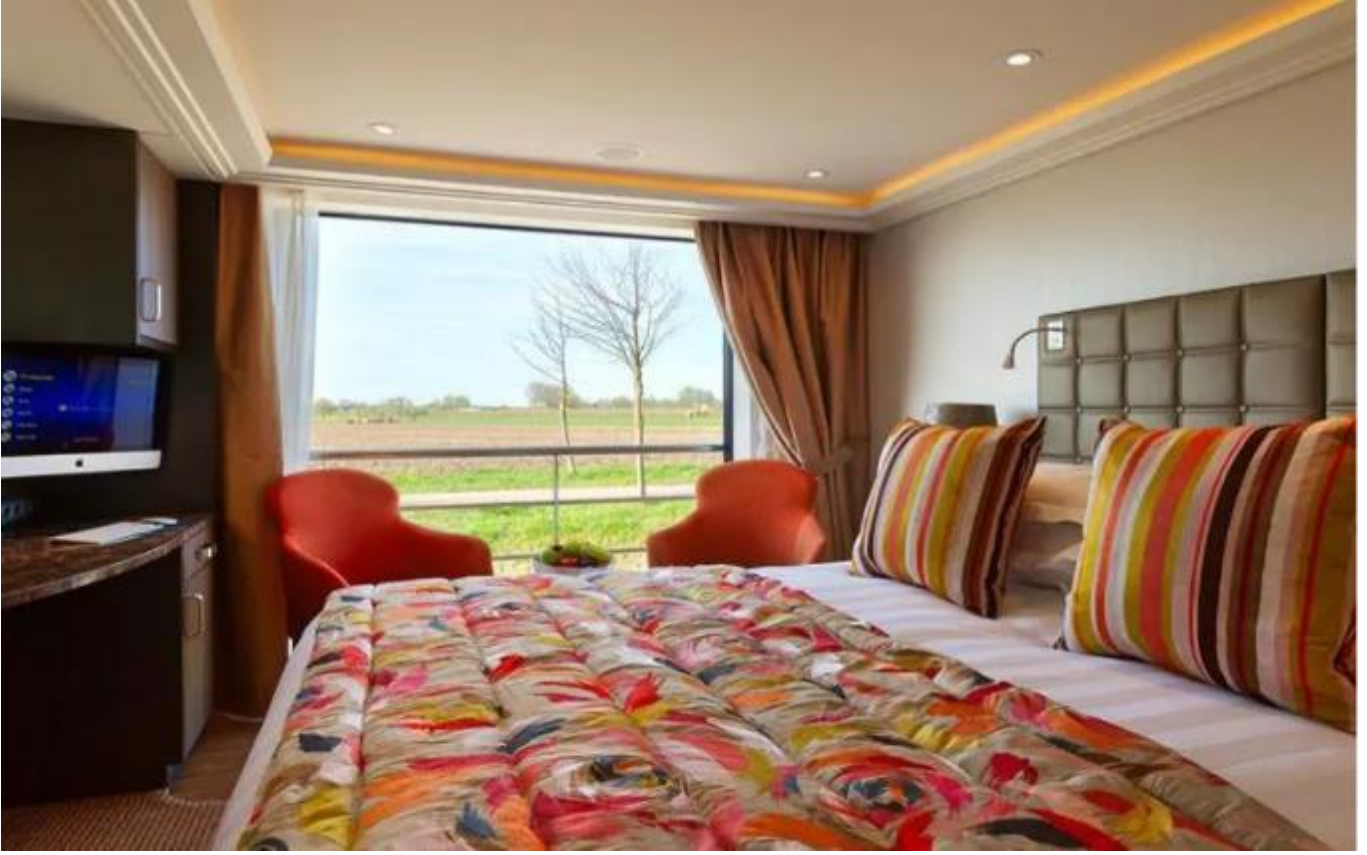
French Balkonlu Kabin (Cat C) – Orta ve Üst Kat