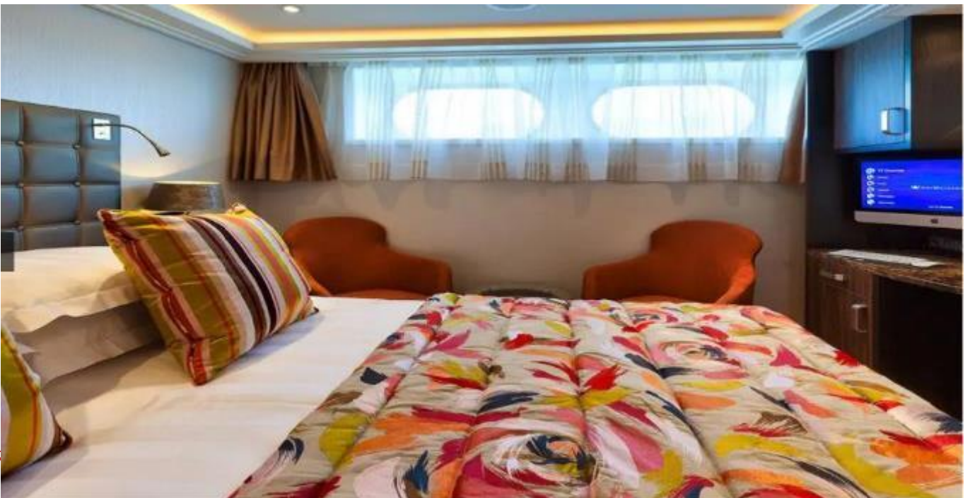
Dış Kabin (Cat E & Cat D) – Alt Kat