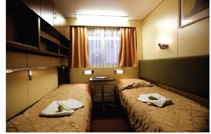
Motorship "Zosima Shashkov"