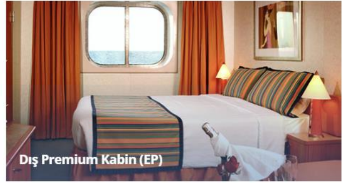
Dış Premium Kabin (EP)

Not: Sigara içilmesi kabinlerde yasaktır, ancak kül tablaları kullanılması durumunda balkonlarda izin verilir.