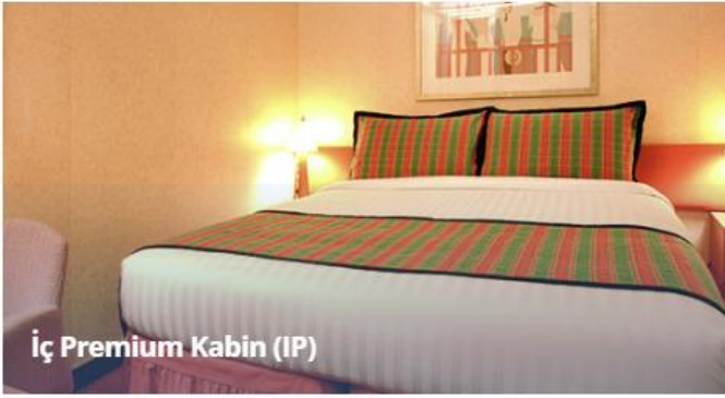
İç Premium Kabin (IP)